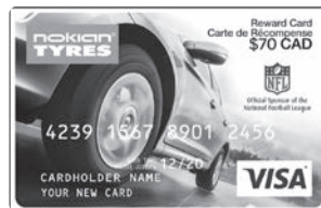
Illustration de la carte prépayée à titre d'exemple seulement. La carte reçue peut être différente de celle représentée ici.

Pour vérifier le statut de votre réclamation: www.NokianTiresRebates.ca .