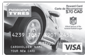
Illustration de la carte prépayée à titre d'exemple seulement. La carte reçue peut être différente de celle représentée ici.

Pour vérifier le statut de votre réclamation: www.NokianTiresRebates.ca .